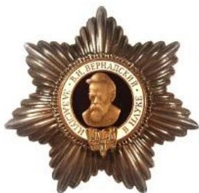
Орден «За заслуги в науке»