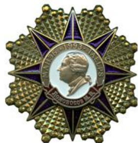
Орден им. М.В. Ломоносова