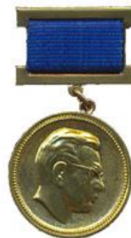
Медаль им. В.А.Легасова