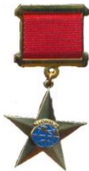
Медаль «Звезда Почета»