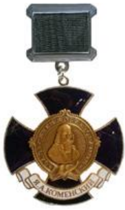
Орден «За заслуги в образовании»