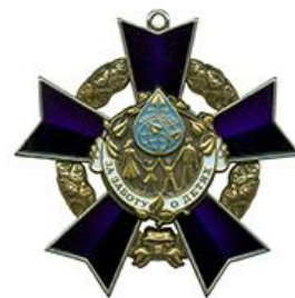
Орден «За заботу о детях»