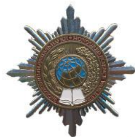
Орден «Звезда Ученого»