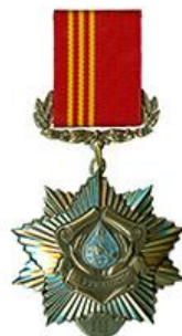
Орден «За гуманизм»