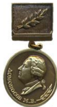
Медаль им. М.В.Ломоносова