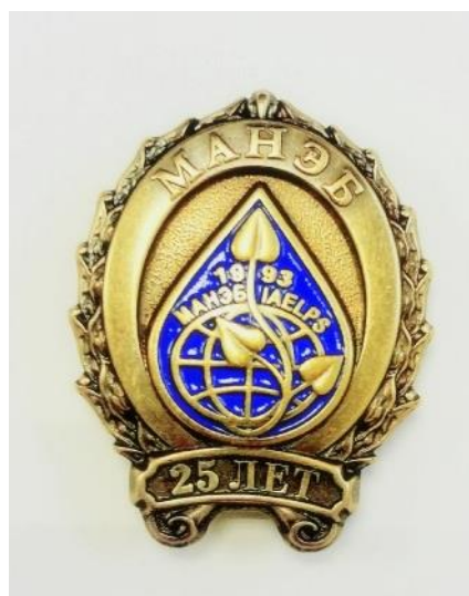
Знак в честь 25-летия МАНЭБ

Решением Геральдического Совета при Президенте РФ от 05 мая 2003 г. эмблема МАНЭБ внесена в Государственный геральдический реестр РФ за номером 101.