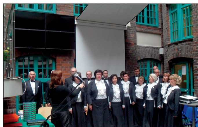
Хор преподавателей исполняет "Gardeamus" в честь начала нового учебного года