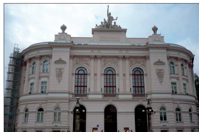
Главное здание Варшавского Политехнического у-та