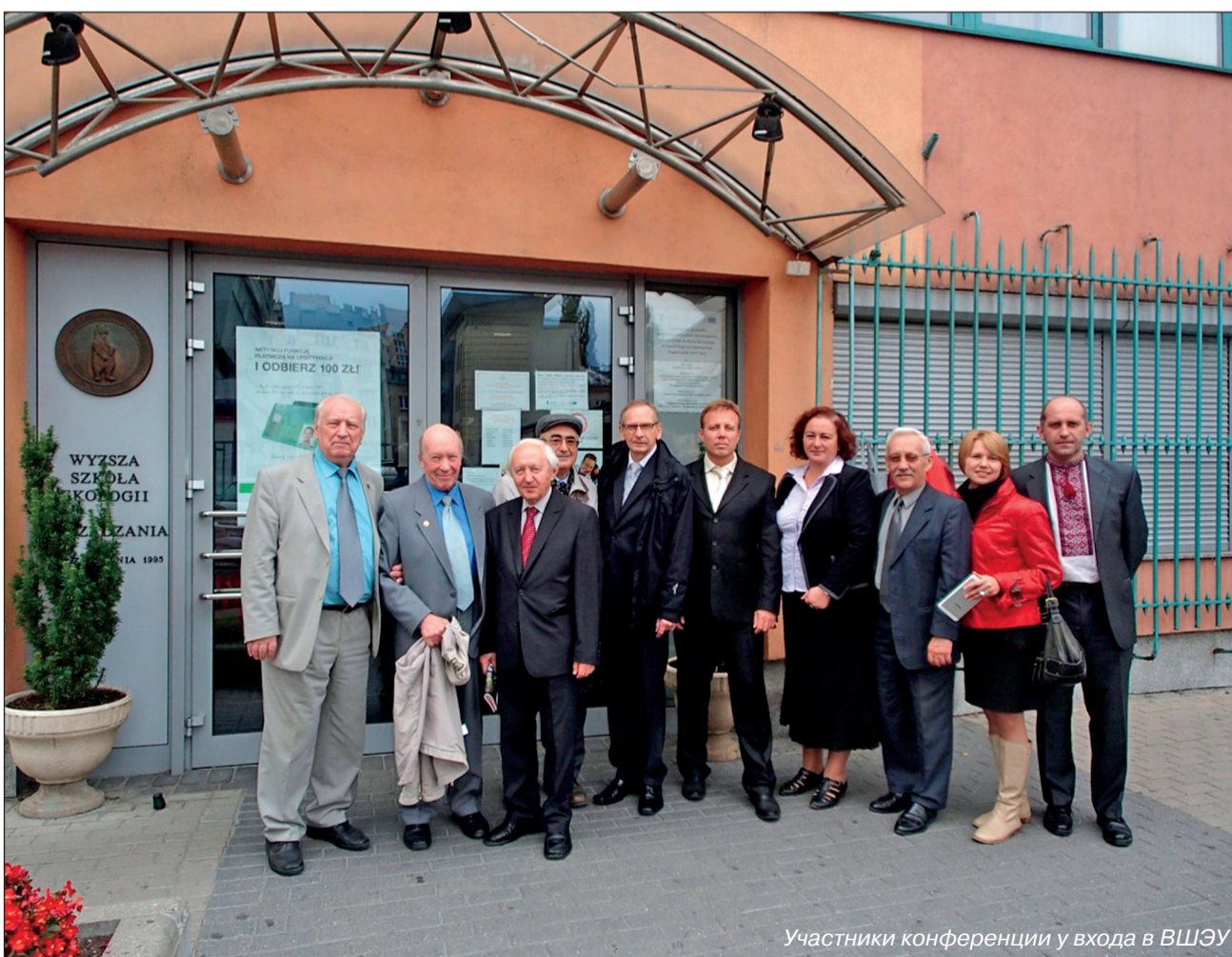
Участники конференции у входа в ВШЭУ